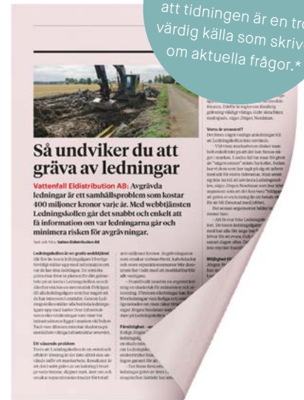
Native för print

att tidningen är en trovärdig källa som skriver om aktuella frågor.*